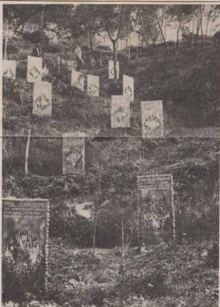
Il gruppo di stele dei Caduti alpini della guerra 1915-18, del Comune di Cappella Maggiore. In occasione del raduno del 12 agosto verrà collocato altro centinaio di stele, con una spesa di oltre due milioni.

Il 12 agosto ci ritroveremo al Bosco delle Penne Mozze: alpini e congiunti di Caduti, particolarmente della provincia di Treviso, saliranno insieme il sentiero che dal monumento porta al grande Crocifisso che — come se presentasse ai visi-