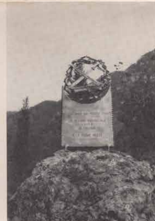
Anche il cippo donato dall'U.N.I.R.R. di Treviso — con l'emblema dei reduci dal fronte russo — è opera dello scultore del ferro Simon Benetton. Sul retro è riportato il brano del bollettino di guerra n. 630 dell'8 febbraio 1943 del Comando Supremo Sovietico, nel quale è testimoniato che L'UNICO CORPO CHE PUÒ RITENERSI IMBATTUTO IN TERRA DI RUSSIA È IL CORPO DI ARMATA ALPINO ITALIANO.

corati d'Italia, e si è dichiarato lietamente sorpreso della rilevanza del Bosco delle Penne Mozze: per la sua ubicazione tanto suggestiva, per questa distesa di piccoli dignitosi monumenti dedicati a ciascuna «penna mozza» della provincia di Treviso e che al di fuori di ogni parvenza retorica fanno suscitare in ogni visitatore quei sentimenti di pietà — e insieme di operante gratitudine — per il sacrificio degli Alpini e di tutti i Soldati caduti con la speranza (che sta a noi non rendere vana) di un'Italia migliore. L'oratore ha poi espresso la soddisfazione del Consiglio Nazionale del Nastro Azzurro per l'iniziativa tanto lodevolmente assunta dalla federazione di Treviso di dotare il Bosco