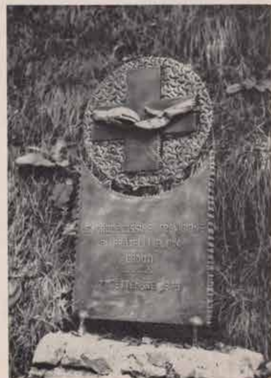
Il cippo che le Crocerossine trevigiane hanno gentilmente dedicato agli Alpini caduti; sul simbolo della C.R.I. è rappresentata una mano di crocerossina in atteggiamento di soccorso al soldato sofferente.

Alla benedizione di questo cippo che sorge tra le stele degli Alpini trevigiani in gran parte caduti nella prima battaglia combattuta sull'amba Uork (la «montagna d'oro» che diede il nome al battaglione) è seguita quella del vicino cippo donato dall'Unione Reduci di Russia e al cui scoprimento ha provveduto il presidente gen. Warimberto Suga. L'opera è stata donata dal-