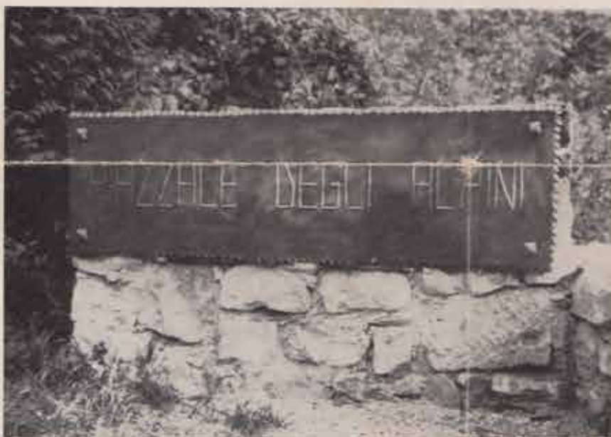
La targa toponomastica all'accesso del piazzale inaugurato dall'on. dott. Gianfranco Rocelli.

zione degli Artiglieri da Montagna, poi incorporata nell'Associazione Nazionale Alpini), Coste-Crespignaga-Madonna della Salute, Cozzuolo, Crespano del Grappa, Cusignana,