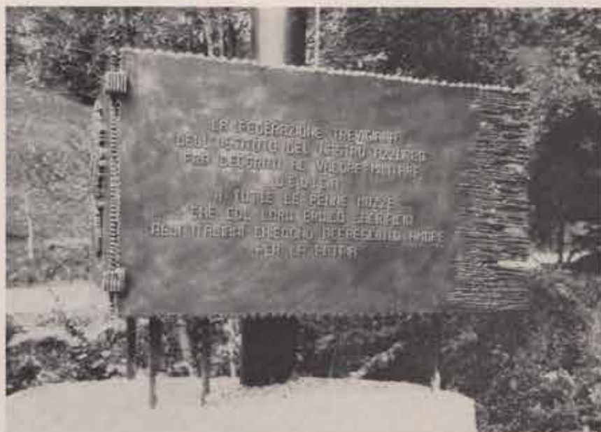
Particolare del cippo portabandiera inaugurato all'accesso del piazzale.