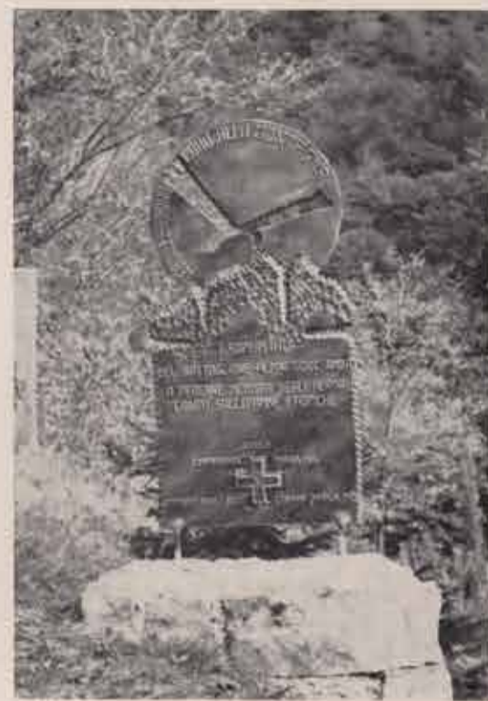
Il cippo sormontato dall'Emblema del Battaglione «Uork Amba» (un'aquila in volo sull'amba Uork) e che i combattenti del battaglione hanno voluto dedicare «a perenne memoria degli alpini caduti sulle ambe etiopiche». La croce, incastonata alla base, contiene terra consacrata del Cimitero degli Eroi esistente a Cheren.

L'UNIRR nel ricordo dei propri Caduti e Dispersi; e sono tanti, in quanto rappresentano circa il 30 per cento delle perdite di militari trevigiani nell'ultimo conflitto.