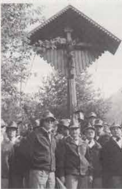
Alcuni componenti del Coro ANA di Vittorio Veneto, che ha eseguito varie canzoni durante lo svolgimento della cerimonia.