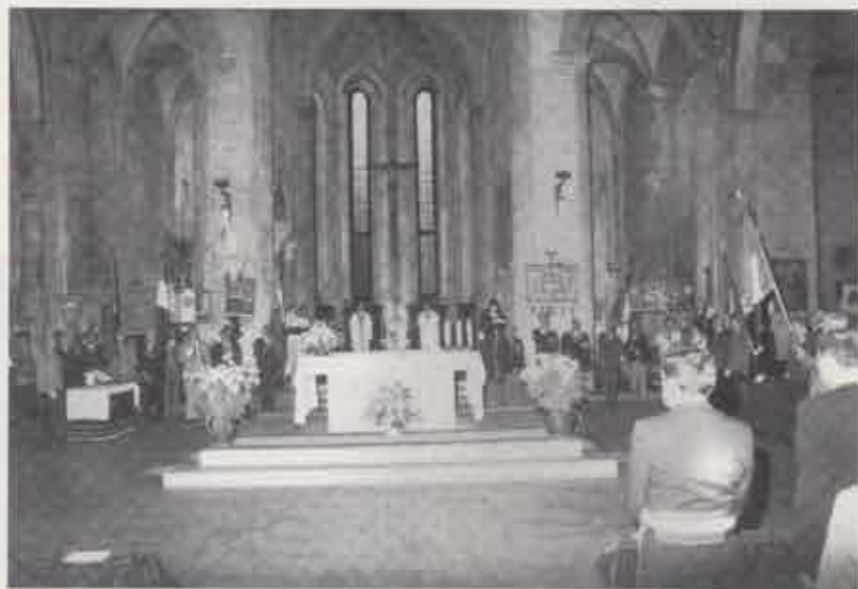
Un aspetto della cerimonia nel tempio di S. Francesco.

Dopo aver ricordato il conseguito stato giuridico dell'Associazione, il celebrante si è soffermato sui fini del sodalizio, e cioè: